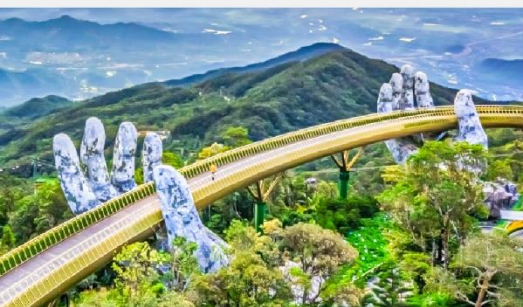
สะพานมือบานาฮิลล์