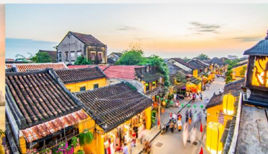
หมู่บ้านฮอยอัน

*กรณีห้องพัkbานาฮิลล์เต็ม ขอสงวนสิทธิ์ในการเปลี่ยนวันเข้าพัก และปรับเปลี่ยนโปรแกรมโดยคำนึงถึงผลประโยชน์ลูกค้าเป็นสำคัญ