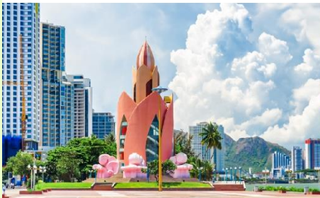
Tram Huong Tower