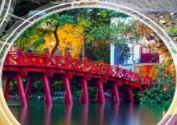
ทะเลสาบคินดาบ