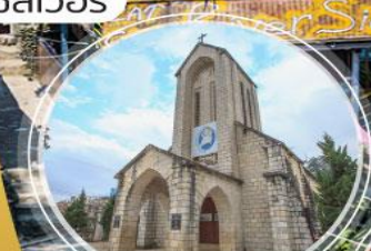
โบสถ์ซาปา