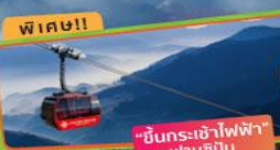
ราคาเริ่มต้น