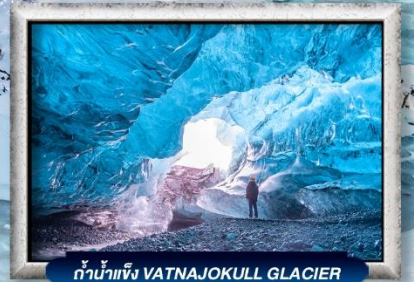
ถ้ำน้ำแข็ง VATNAJOKULL GLACIER

บินทรู สายการบิน Full Service | พิเศษ! ทานอาหารโดมกระจกจิว 360 องศา