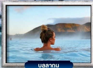
บูลลาทูน