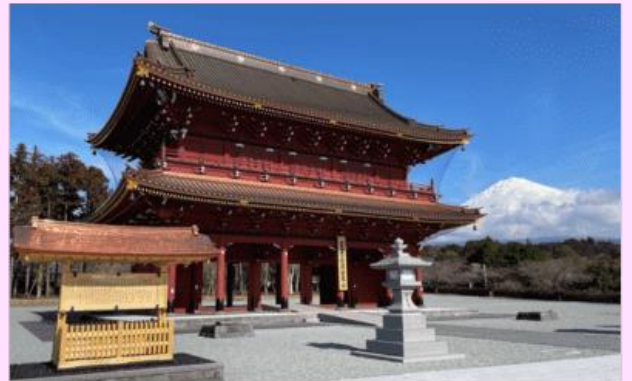
รูปใช้เพื่อประกอบการโฆษณาเท่านั้น