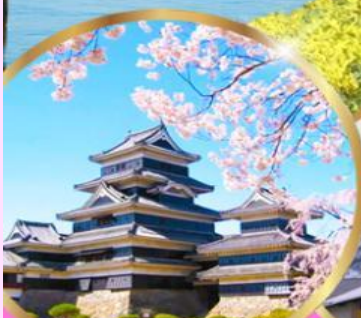
ปราสาทมัตสึโมโตะ