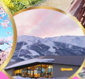
Starbuck snow peak land