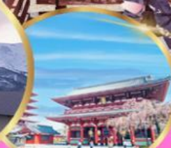
วัดเซ็นโซจิ