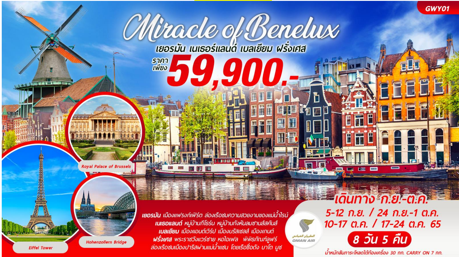
Royal Palace of Brussels