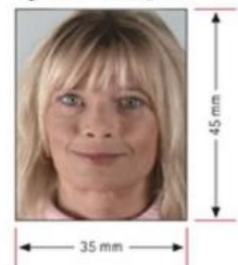
รูปถ่ายมาตรฐาน

2. รูปถ่าย รูปถ่ายสี ขนาดตรงขนาด 35มม.x 45มม. ใบหน้า 90 เปอร์เซ็นต์ของพื้นที่รูปถ่าย จำนวน 2 ใบ ห้ามตกแต่งรูป ถ่ายจากร้านถ่ายรูปเท่านั้น ห้ามสวมแว่นตา หรือเครื่องประดับ , ต้องไม่เป็นรูปสติ๊กเกอร์ **แนะนำให้ลูกค้าไปถ่ายในสถานทูต 180 บาท จำนวน 4 รูปนะคะ หากจำเป็น**