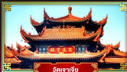
วัดจาเจีย