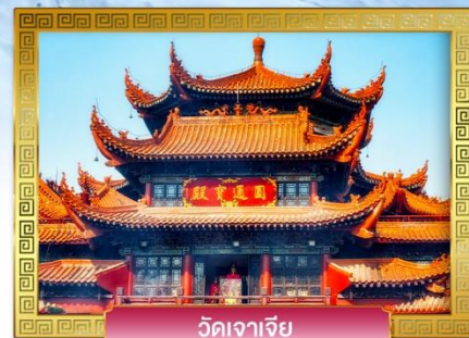
วัดจาเจีย