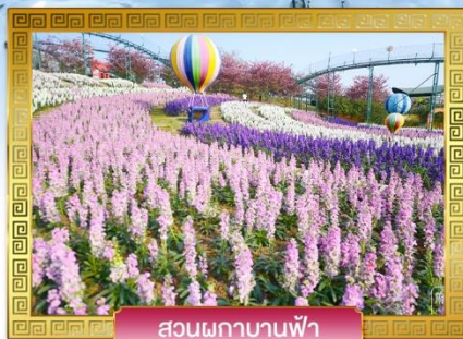
สวนพลาบานฟ้า